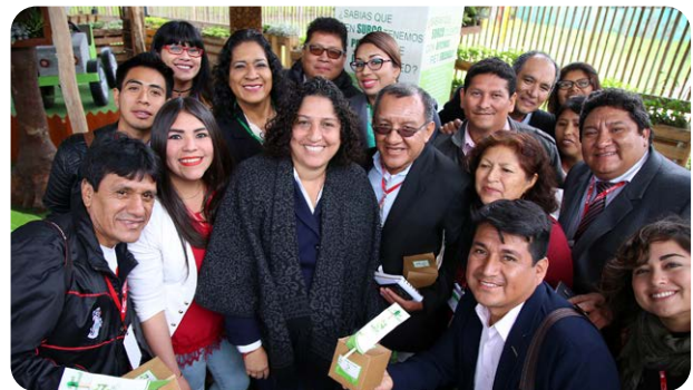
La ministra Fabiola Muñoz en el Primer Taller Nacional de Comunicadores de Perú 2018.

El intercambio de información es un factor clave para que los procesos de los PNAD sean eficaces, y muchos gobiernos están optando por desarrollar estrategias de comunicación de los PNAD. La comunicación clara y decidida con las partes interesadas gubernamentales y no gubernamentales a lo largo de todo el proceso del PNAD ayuda a aumentar la conciencia sobre la adaptación y el proceso del PNAD, a aclarar las funciones de las partes interesadas, a priorizar las medidas de adaptación, a aumentar el perfil de la adaptación en los medios de comunicación y a inspirar la acción. Al crear y aplicar una estrategia de comunicaciones para apoyar el proceso del PNAD, los equipos del PNAD pueden entablar un diálogo participativo e